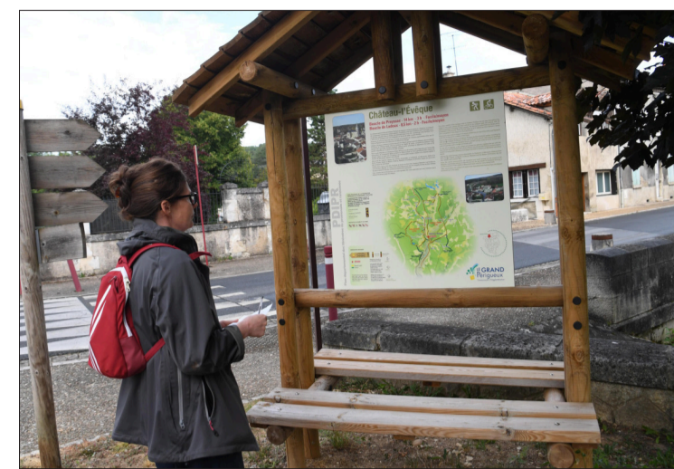
Le parcours est expliqué à l'entrée du village.