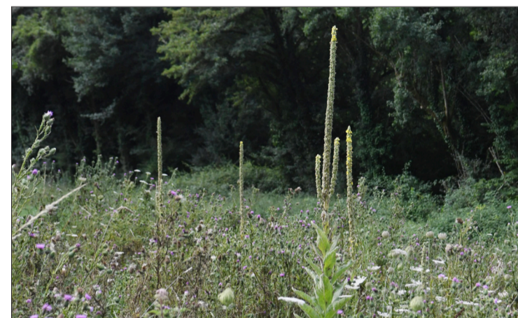
La flore sur la boucle du Ladoux.