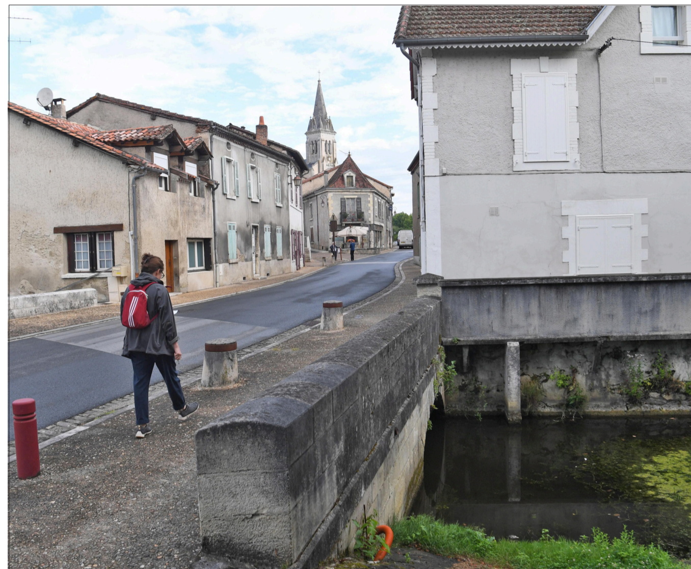
Le village joliment restauré.

Noël, qui est décidément très en verve, poursuit sans transition sur le déboisement conséquent qui sévit sur la commune et dans les communes alen-