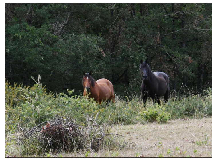
Le temps de la randonnée, des chevaux ont été aperçus.