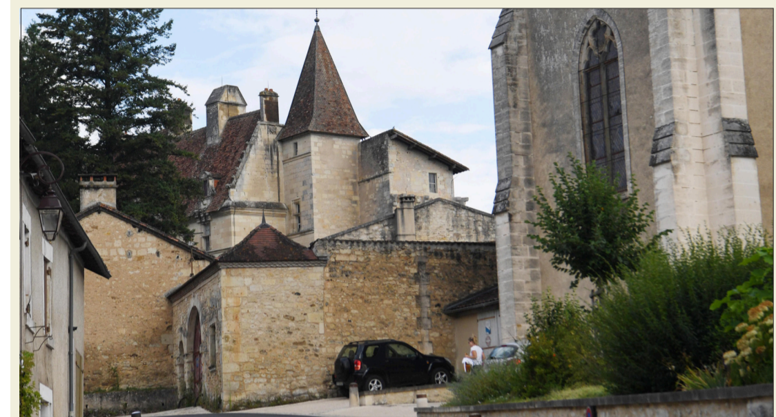
Le château de Château-l'Évêque.

Une commune avec un riche passé historique