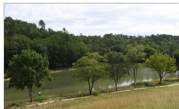
L'étang du Ladoux.