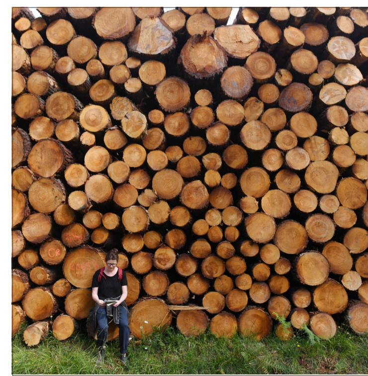
Sur la route dite du « Milieu du bois »