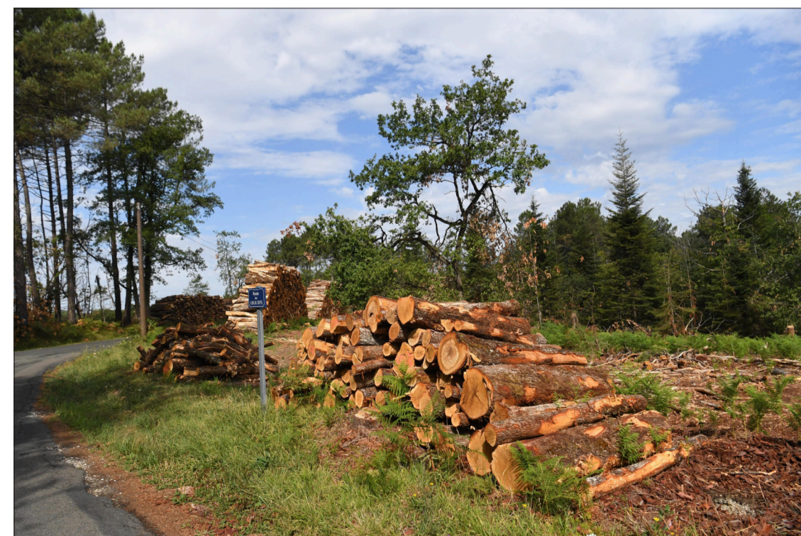
Le déboisement est conséquent sur la commune.

espace de pique-nique, très pratique et bien situé face à l'étang, qui est ouvert aux pêcheurs amateurs. Après l'étang, je remonte sur la gauche vers les « Colys », dernière grimpée avant de rejoindre la rue Rachilde (une romancière née à Château-l'Évêque au milieu du XIX e siècle) qui ramène au château. La balade est intéressante, elle dure deux heures, sur un parcours vallonné, avec son léger dénivélé ; je constate une fois de plus la grande diversité des espèces boisées, la richesse de la flore et l'important réseau hydrographique de ce bassin drainé notamment par les eaux de la Beauronne.