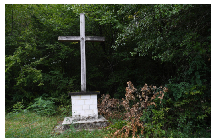
Le petit patrimoine est présent.