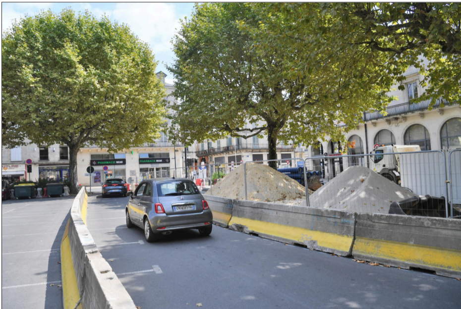
La place Bugeaud a été coupée pour permettre la circulation des voitures.