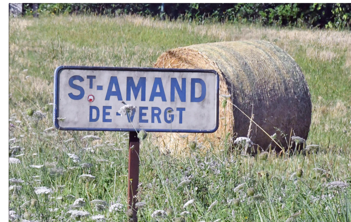
La boucle de Neufont démarre à l'entrée du village.

Depuis Périgueux, on emprunte la N 21 puis la D 43 et la D 8, qui passe par le lac de Neufont, pour rejoindre le bourg de Saint-Amand-de-Vergt. Il est encore possible d'assister au festival de musique classique en l'église romane de Saint-Amand-de-Vergt ! Le dernier concert se tient ce soir à 21h, avec un duo cor et harpe qui jouera notamment Saint-Saëns, Ravel et Strauss. Côté randonnée, la boucle du Pas de l'Âne se fait sur la partie sud du village. Le lac de Neufont est actuellement fermé car entièrement réaménagé par le Grand Périgueux, il sera rouvert au public à l'été 2023. C'est une base de loisirs importante (paddle, pédalos, canoë) qui accueillera aussi des habitats légers de loisirs, un camping et une quinquette.