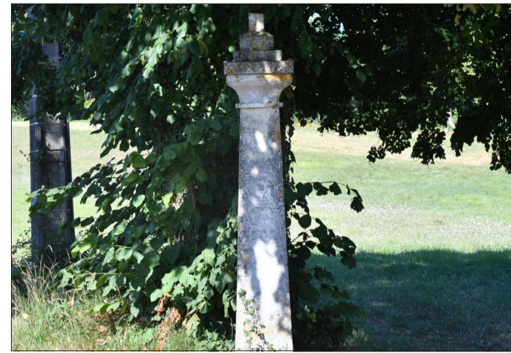
La croix des Piquants est à découvrir le long de la route.