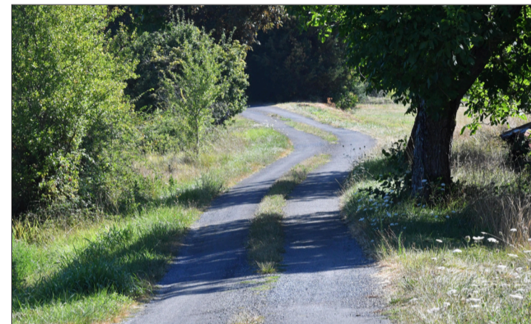
La boucle de Neufont longe de nombreux bosquets.