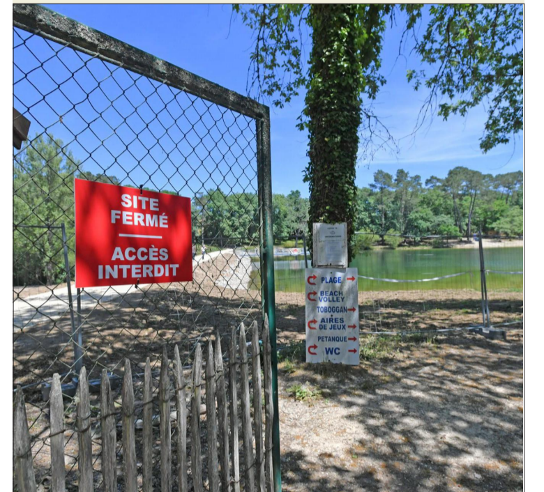
Du côté de l'étang de Neufont, le public ne pourra pas se délasser - hélas ! - avant l'été 2023.

Depuis Périgueux, on emprunte la N 21 puis la D 43 et la D 8, qui passe par le lac de Neufont, pour rejoindre le bourg de Saint-Amand-de-Vergt. Il est encore possible d'assister au festival de musique classique en l'église romane de Saint-Amand-de-Vergt ! Le dernier concert se tient ce soir à 21h, avec un duo cor et harpe qui jouera notamment Saint-Saëns, Ravel et Strauss. Côté randonnée, la boucle du Pas de l'Âne se fait sur la partie sud du village. Le lac de Neufont est actuellement fermé car entièrement réaménagé par le Grand Périgueux, il sera rouvert au public à l'été 2023. C'est une base de loisirs importante (paddle, pédalos, canoë) qui accueillera aussi des habitats légers de loisirs, un camping et une quinquette.