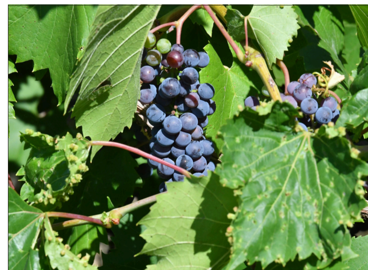
Le raisin est déjà mur !

Le petit village de Saint-Amand-de-Vergt, à une vingtaine de kilomètres au sud de Périgueux, offre au visiteur deux jolies promenades bucoliques en pleine nature. J'ai choisi, cette semaine, la randonnée de la boucle de Neufont, qui part du centre du bourg.