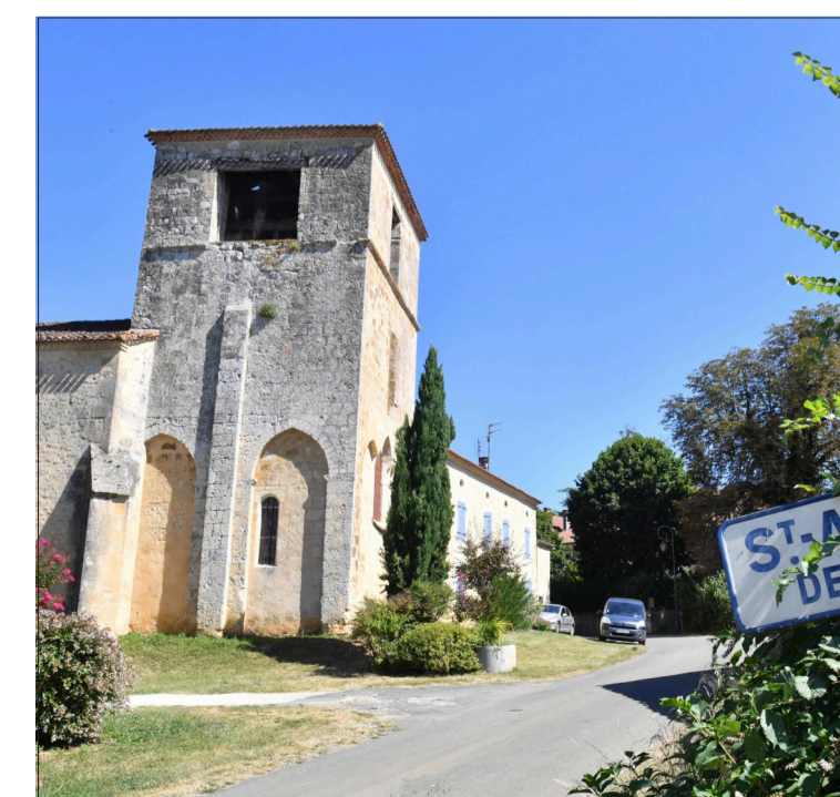
L'église de Saint-Amand-de-Vergt.