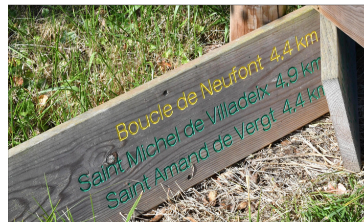
Les panneaux indicateurs sont nombreux sur la route.