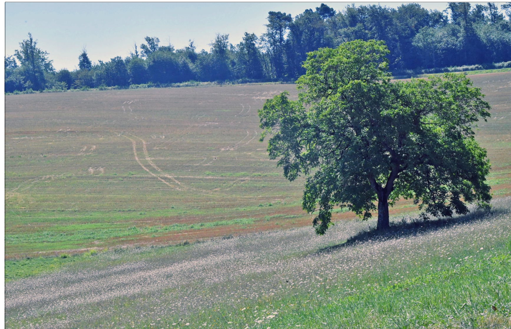
La boucle de Neufont de 7,4 km est plus facile que celle du Pas de l'Âne.

Cette fois-ci je me retrouve à travers prés, les foin ont été